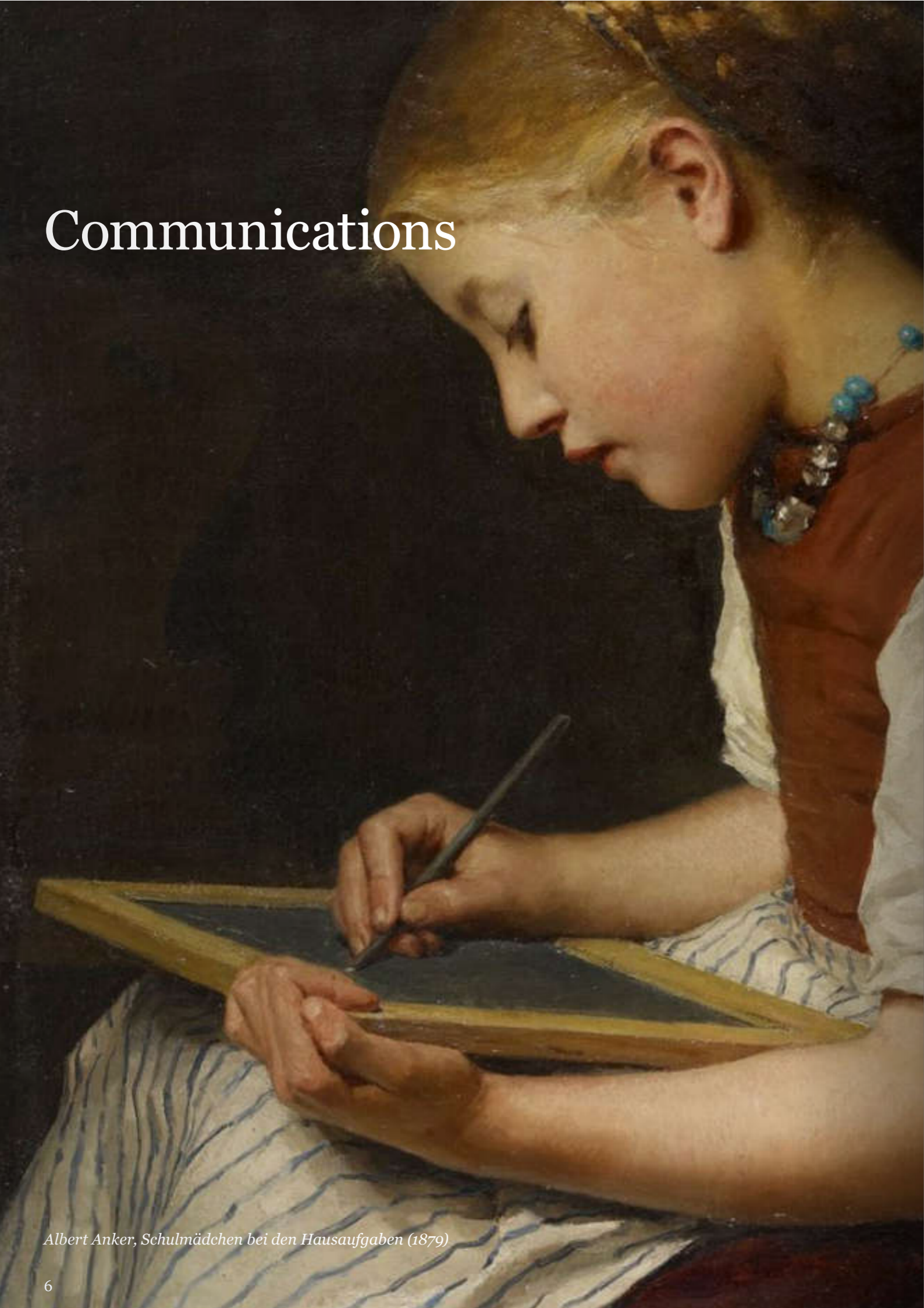
Albert Anker, Schulmädchen bei den Hausaufgaben (1879)

Mittlerweile unterstützen wir mit unserem Team rund 60 Unternehmen in der Presse- und Öffentlichkeitsarbeit, bei der Kapitalmarktkommunikation sowie in Sondersituationen wie Unternehmensübernahmen oder Krisenlagen. Hinzu kommen Projekt- und Standortkommunikations-Mandate sowie diverse Marketingprojekte wie die Entwicklung von Stakeholder Reports, Mailings oder Websites.