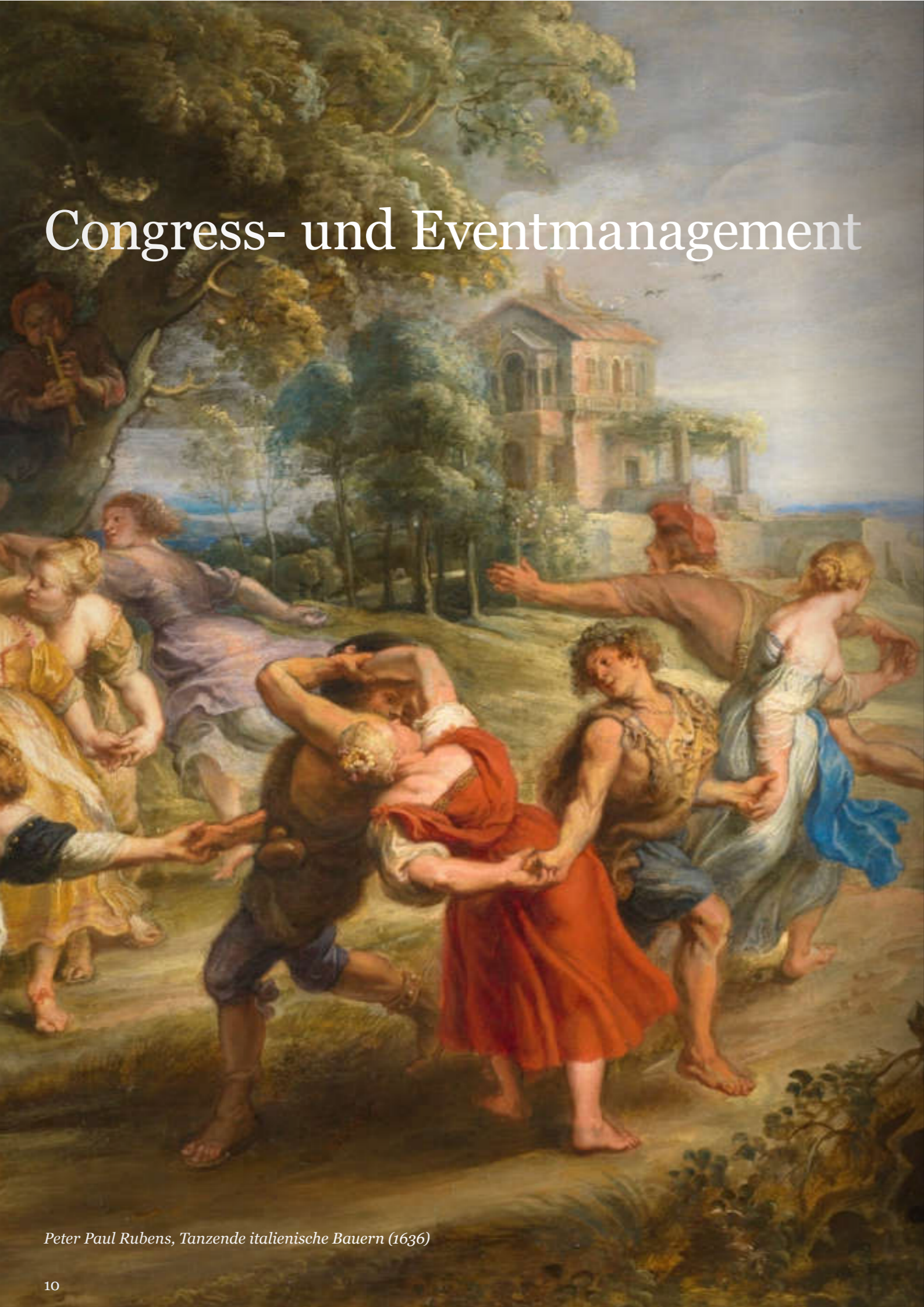
Peter Paul Rubens, Tanzende italienische Bauern (1636)